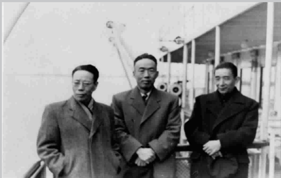
○ 下图 1953年赵九章(前排右起)与华罗庚、钱三强在前苏联