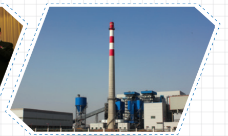
2013年，中科集团汾阳市500吨日生活垃圾焚烧发电项目投产