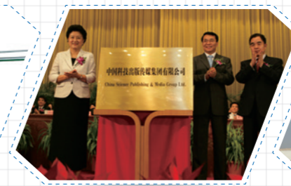
2011年7月，中国科技出版传媒集团有限公司揭牌