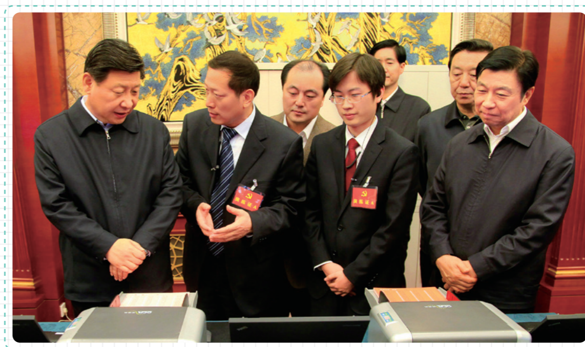
习近平总书记视察成都信息会议选举系统

根据国务院关于中国科学院经营性国有资产管理体制改革试点的批复，中国科学院国有资产经营有限责任公司（简称国科控股）2002年正式成立，在中国科学院的授权下统一管理院所两级的经营性国有资产。秉承“助力科技创新、实现资本增值”的历史使命，中国科学院通过推动实施企业分类管理、股改上市、战略协同和资源整合等战略举措，引导相关私募股权投资基金（VC/PE）重点关注培育期和成长期高新技术产业化项目；积极探索创新链与产业链有效嫁接的途径，有效助力科技创新和成果转移转化与规模产业化，促进企业不断提升经营水平，强化核心竞争力，做强做大主营业务，努力成为本行业的优秀企业和领导者。