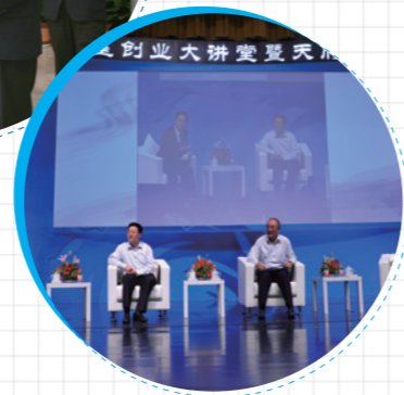
2011年，中国科学院联想学院联想之星创业大讲堂