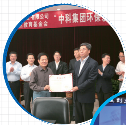
2013年，中科集团捐赠设立环保发展基金

院所投资企业始终秉持高度的社会责任感，积极倡导和参与可持续的社会公益和价值创造活动，近年来累计捐资助学逾10亿元。中国科学院携手联想控股创办了独具特色的中国科学院联想学院，致力于为社会培育新一代创新创业人才，促进科技成果的转移转化与规模产业化，助力创新链与产业链的有效嫁接，推动我国高新技术产业发展。成立五年来，中国科学院联想学院连续组织实施了数十个培训项目，培训院内外学员逾2000人次。