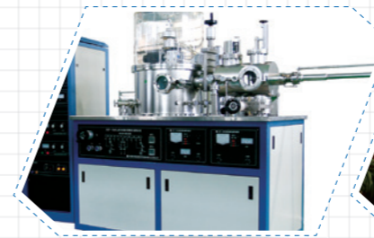
沈阳科仪JGP-560型双室磁控溅射系统