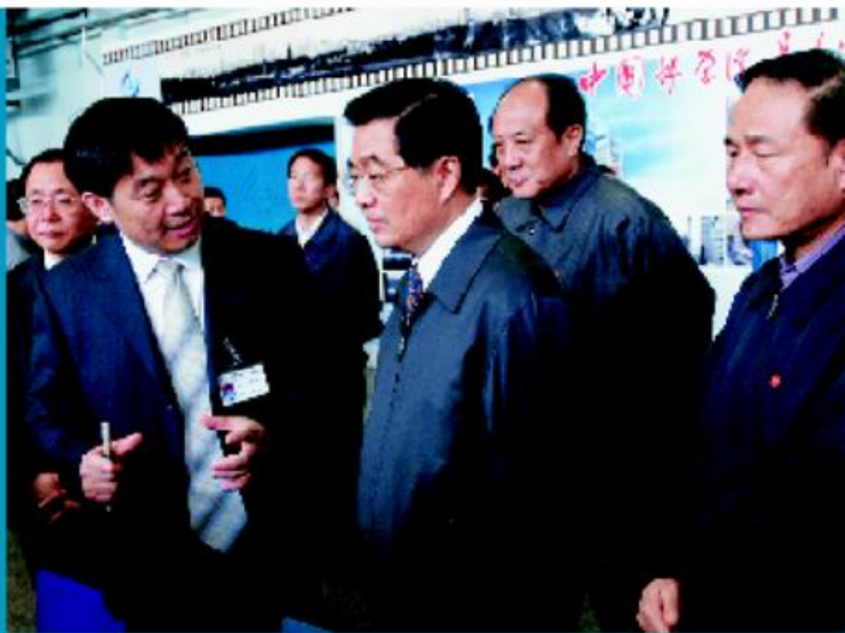
胡锦涛总书记(中) 视察长春光学精密机械与物理研究所