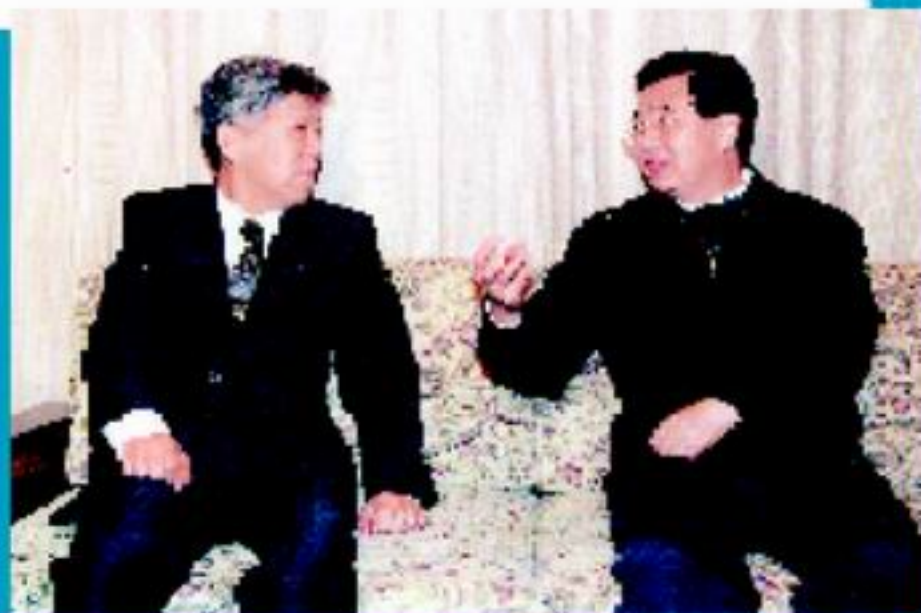
胡锦涛总书记(右)看望杨乐院士

温家宝总理1月17日参观了中国科学院战略高技术成果展,10月31日看望了吴文俊院士、刘东生院士和李国杰院士,11月1日视察了我院古脊椎动物与古人类研究所、计算技术研究所和物理研究所。温家宝在与科技人